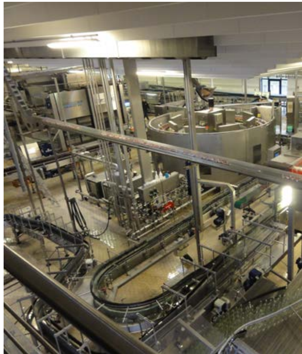
Линия розлива глубинной биоактивной бутилированной питьевой воды

Гидрогеологическая структура региона добычи состоит из чередующихся трещиноватых горных базальтовых пород, через которые просачиваются глубинные восходящие подземные воды.